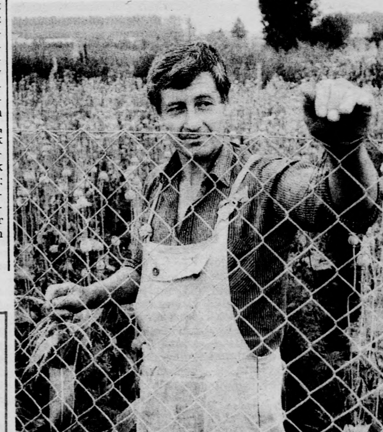
„Ahhoz képest, hogy először vettem mákot, jó a termés...”