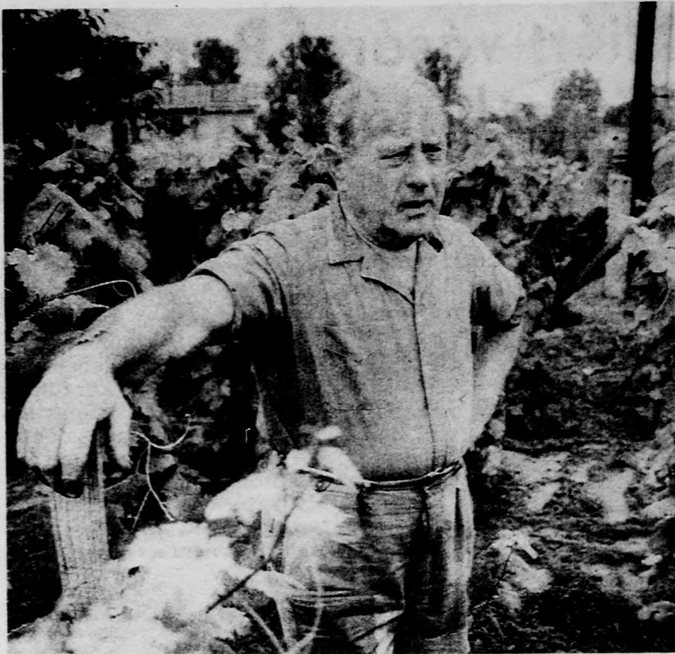
„Ezelőtt egy héttel rengeteg pándi meggy volt...”

ahoz elengedhetetlenek tartott egy olyan MSZMP-t, amely szakít a hierarchikus, felülről épített és irányított szervezeti felépítéssel, s valóban politizáló, mozgalmi jellegű párttal alakul át. Németh Miklós nem rejtette véka alá véleményét, miszerint e tekintetben az MSZMP késésben van, de — mint hozzáfűzte — e késés nem behozhatatlan. Az átmenetet előkészítő, háromoldalú egyeztető tárgyalásokról a miniszterelnök megjegyezte: érez bizonyos mértékű obstrukciót az egyes pártok részéről, holott most minden politikai tömörülésnek — a pártterületek felretéve — az ország jövőjét, a továbblépést kellene szem előtt tartania. E továbblépés fő zálogaként értékelte Németh Miklós egy sajátos ma-