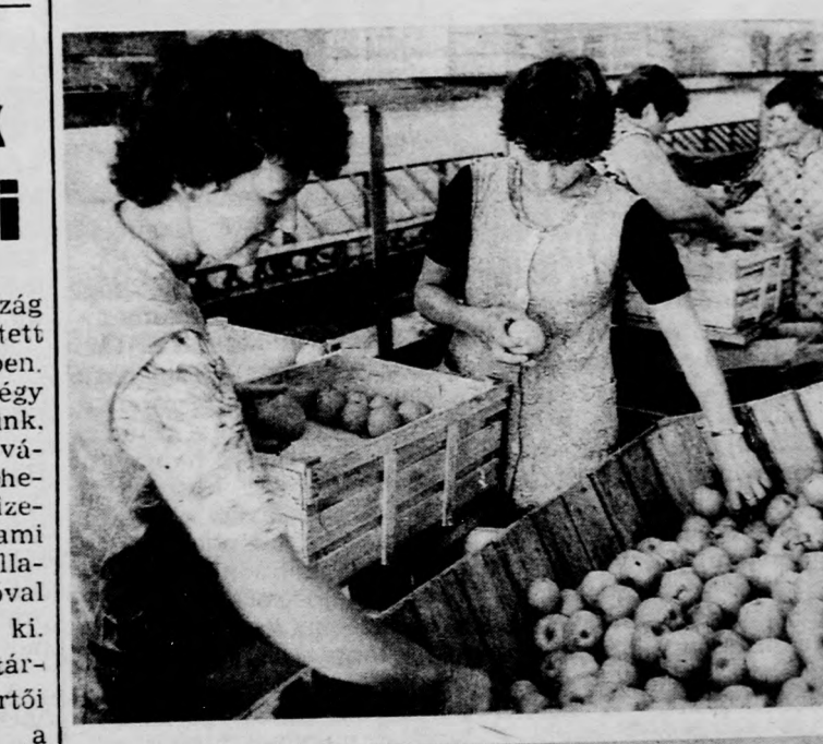
...és a válogatóknak is