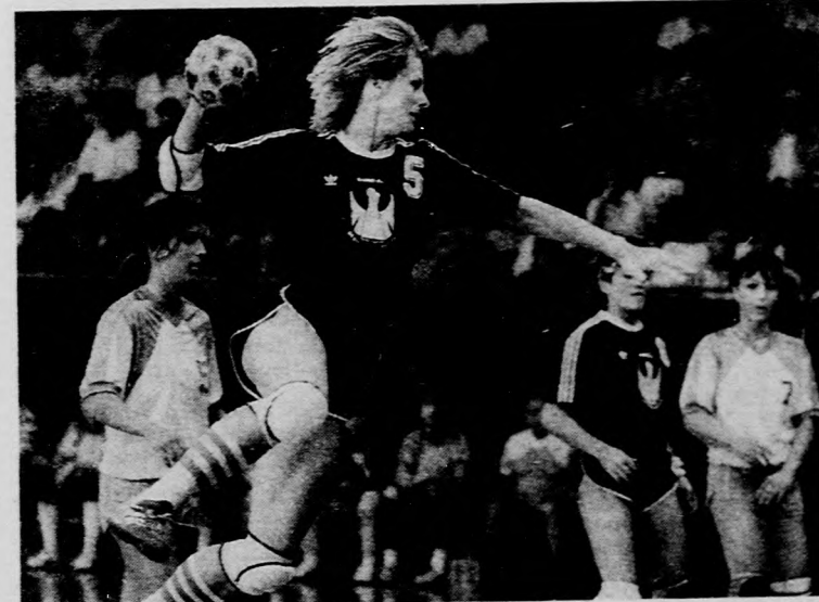
Rádiné (5) mérkőzésről mérkőzésre formába lendül.

Bp. Spartacus: Acsbog — Kántor 1, ERDCS 11,8, Angyal, Szabó E. 2, VIGLÁSI 6, Zoltai. — Csere: Varsányi (kapus), Luzzi 2, Rácz. Edző: Szabó István. Kiállítás: 10, illetve 10 perc. Hétméteres: 7/5, illetve 8/8.