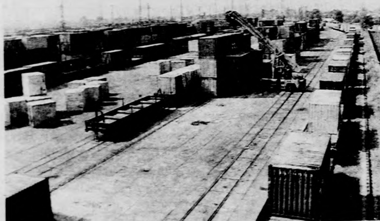
A tervekhez képest 250 ezer tonna az áruszállítás lemaradása

— A MÁV áruforgalma jól tükrözi a magyar gazdaságban végbemenő folyamatokat. A tervekhez képest 250 ezer tonna lemaradásunk van, aminek a csökkentését korábban a gabonaszállítástól vártuk. Annak, hogy a reményeink nem teljesül-