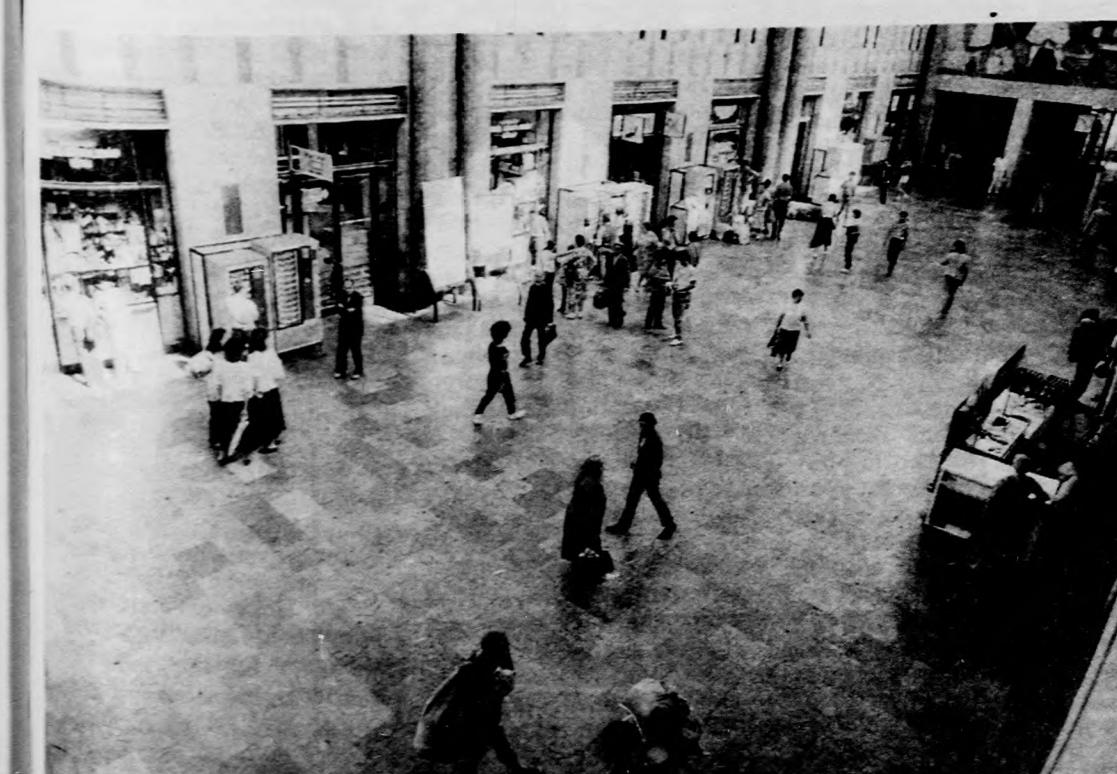
A vartnál többben és mind hosszabb távolságra utaznak