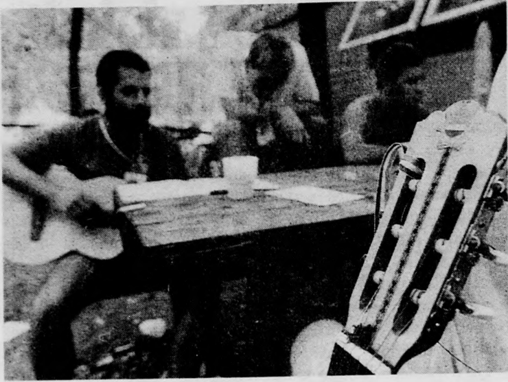
Szól a blues-zene — Magyarországról

Érdeklődés hiányára kereszteszélődik át akkor, ha azt nézzük, hogyan tekintette megynék és Debrecen ezt a nagy hagyományokat magáénak mondó maratoni rendezvényt. A válasz si-