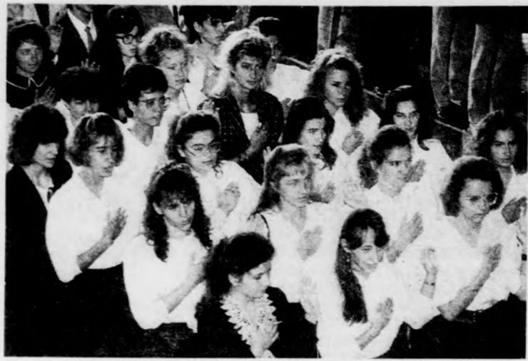
Az elsőévesek fogadalomtétele