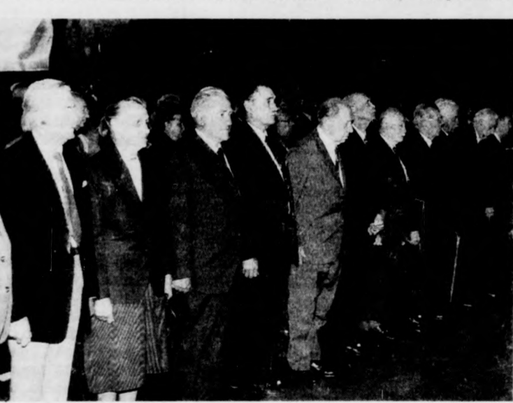
A vas-, gyémánt- illetve aranydiplomások egy csoportja