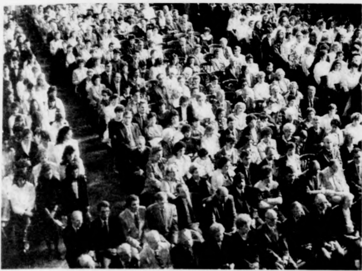
Az ünnepség résztvevői