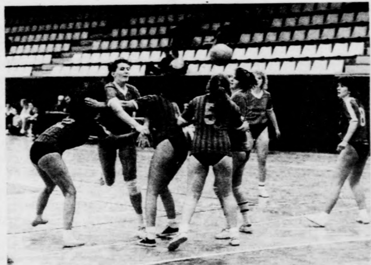
A lányok döntő mérkőzésén a csokonaisok támadnak a hajdúböszörményiek ellen.

Végeredmény a lányoknál: 1. Csokonai-gimnázium, 2. Bocskai-gimnázium (Hajdú-böszörmény), 3. Közgazdasági Szakközépiskola (Hajdúszoboszló), 4. Bethlen Gábor Szakközépiskola (Debrecen). A fiúknál: 1. Csokonai-gimnázium, 2. Mechwart A. Szakközépiskola (Debrecen), 3. Arany János Gimnázium (Berettyóújfalú), 4. Körösi Csoma Sándor Gimnázium (Hajdúnánás).