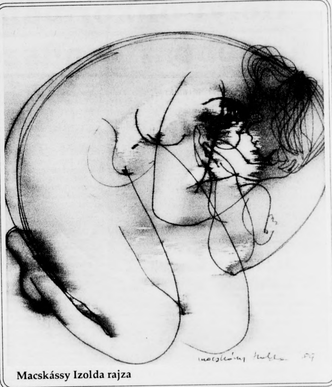
Macskássy Izolda rajza