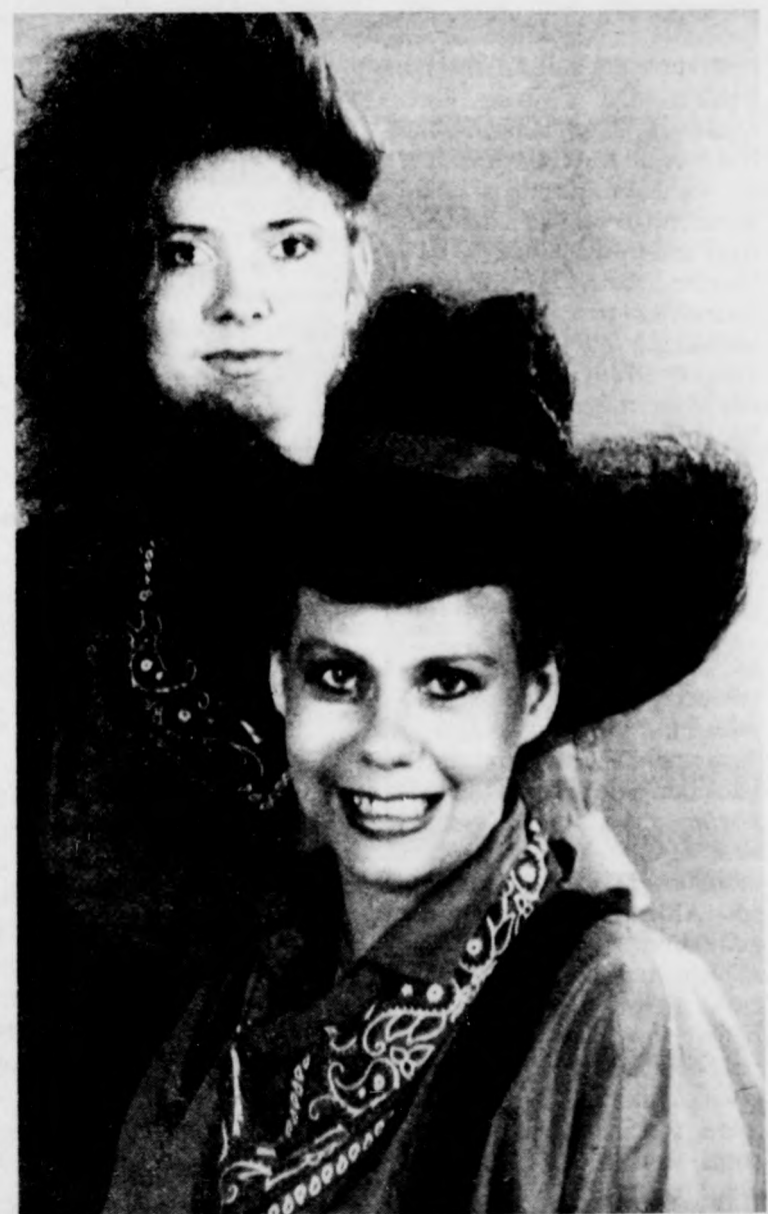
Ha nincs kalapod, csináltass magadnak, de ne a kalappal, hanem a fodrással