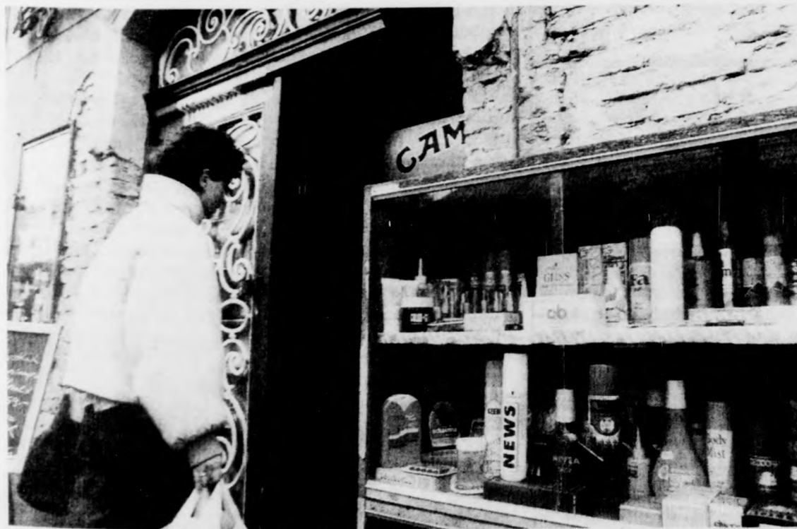
Van, aki kinyit...

Nem kétséges, hogy e két napon a kiskereskedők nem jelentős bevételről esnek el. Persze lesznek olyanok, akik kinyitnak. Nekik fontosak ezen a két napon is a vásárlók. Ők nem hisznek abban, hogy a lassan egymást érő munkabeszüntetések az ország felemelkedéséhez vezetnek. Valóban, hová jutunk, ha mindenki úgy gondolja, ez az egyetlen elintézési mód? Hiszen amúgy is roskadozó gazdaságunkat az egyre szaporodó sztrájkhullámok még inkább gyengítik... - gábrriel -