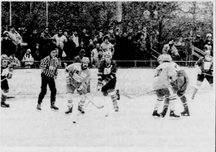
1. Vasárnap nem fáztak a szurkolók. A kellemes időben, biztosan győzött csapatuk