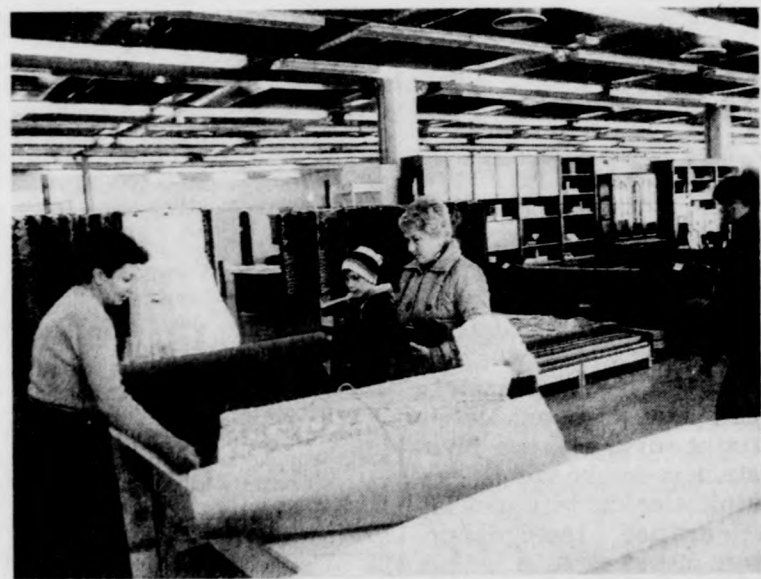
A földszintre költöztetett textilosztály máris nagy forgalmat bonyolít

— Sajnos, a 27 millió forintos alaptőke csak a legszükségesebb kiadásainkra elég. A raktár korszerűsítésére egyelőre nincs pénz, csupán távoli célunk lehet az ottani körülmények javítása.