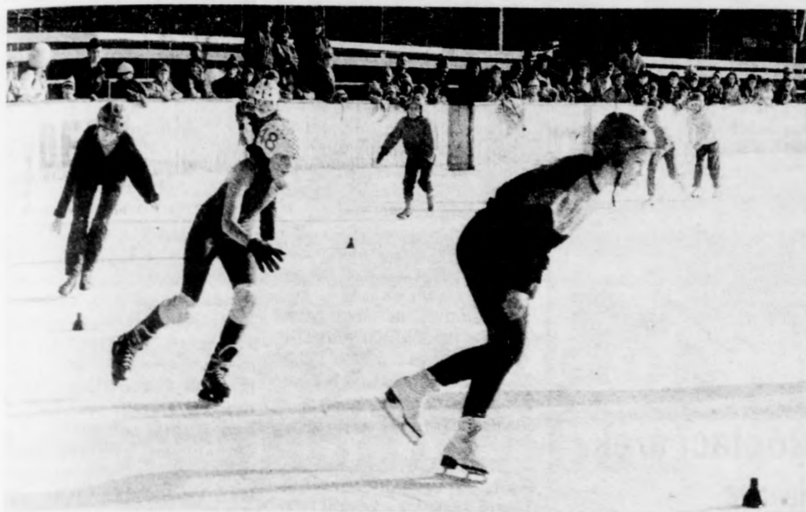
Az 5-6. osztályos lányok küzdenek a győzelemért