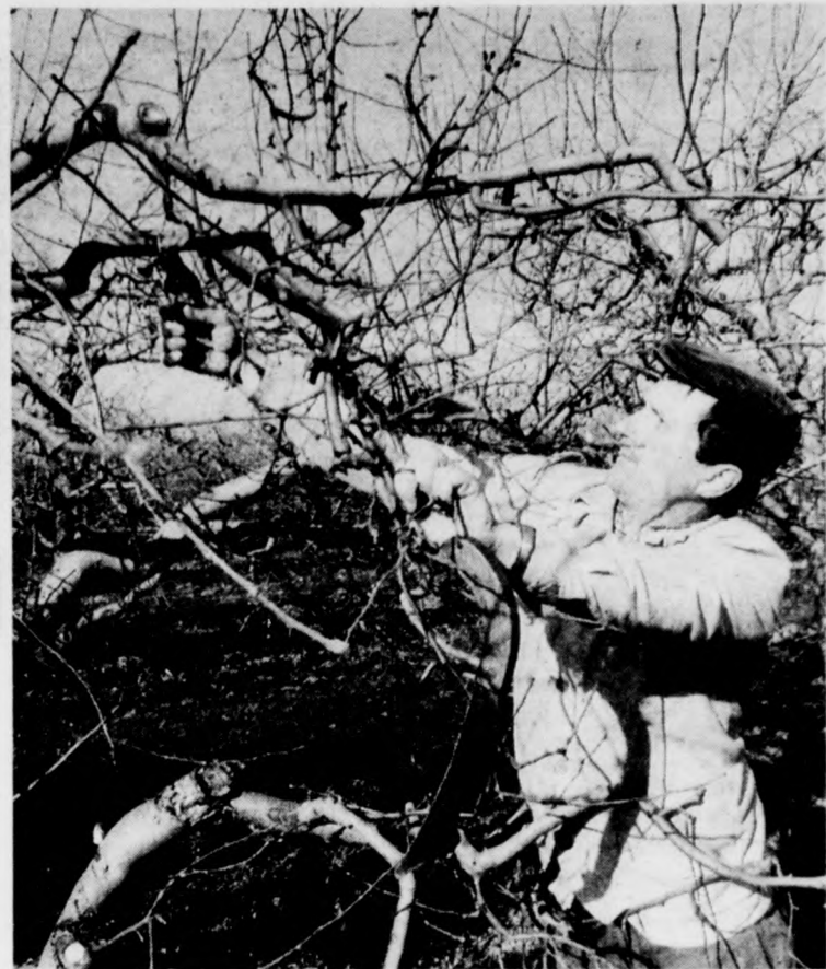
Elkezdődött a metszés az almáskertekben