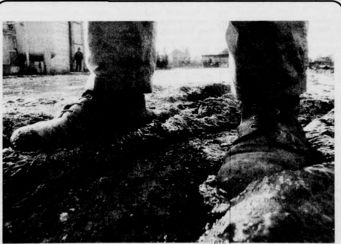
Úton Európába...

Az engedélyezés is egyszerűsödött. Nem szükséges a támogatás megszerzéséhez az ágazati szakszervezet, illetve minisztérium javaslata. Ezekben az ügyekben a területi, megyei tanács munkaügyi szakigazgatási szerve dönt, kikérve az Állami Bér- és Munkaügyi Hivatal véleményét az átvállalásról. 1989-ben a felszámolásoknál 334 dolgozónál vállalták át a Foglalkoztatási Alapból a korengedményes nyugdíjazás teljes összegét, a jelentős léptetéssel végrehajtott átszervezéseknel pedig 688 dolgozónál fedezték a költségek 50 százalékát. (MTI)