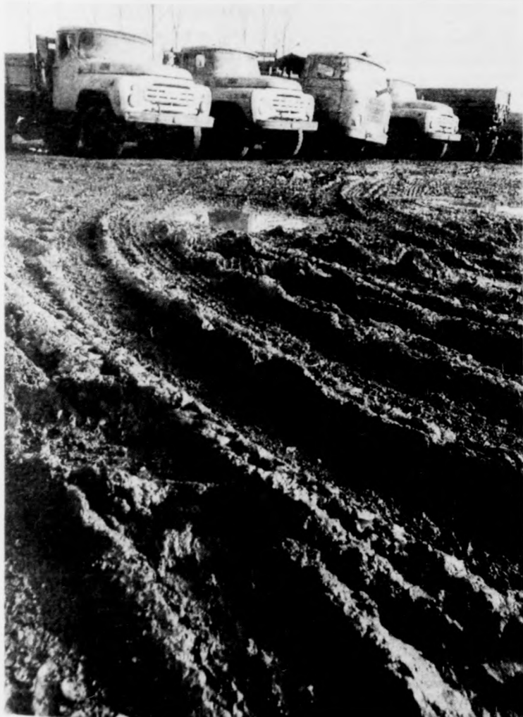
Innen indulnak és ide térnek vissza