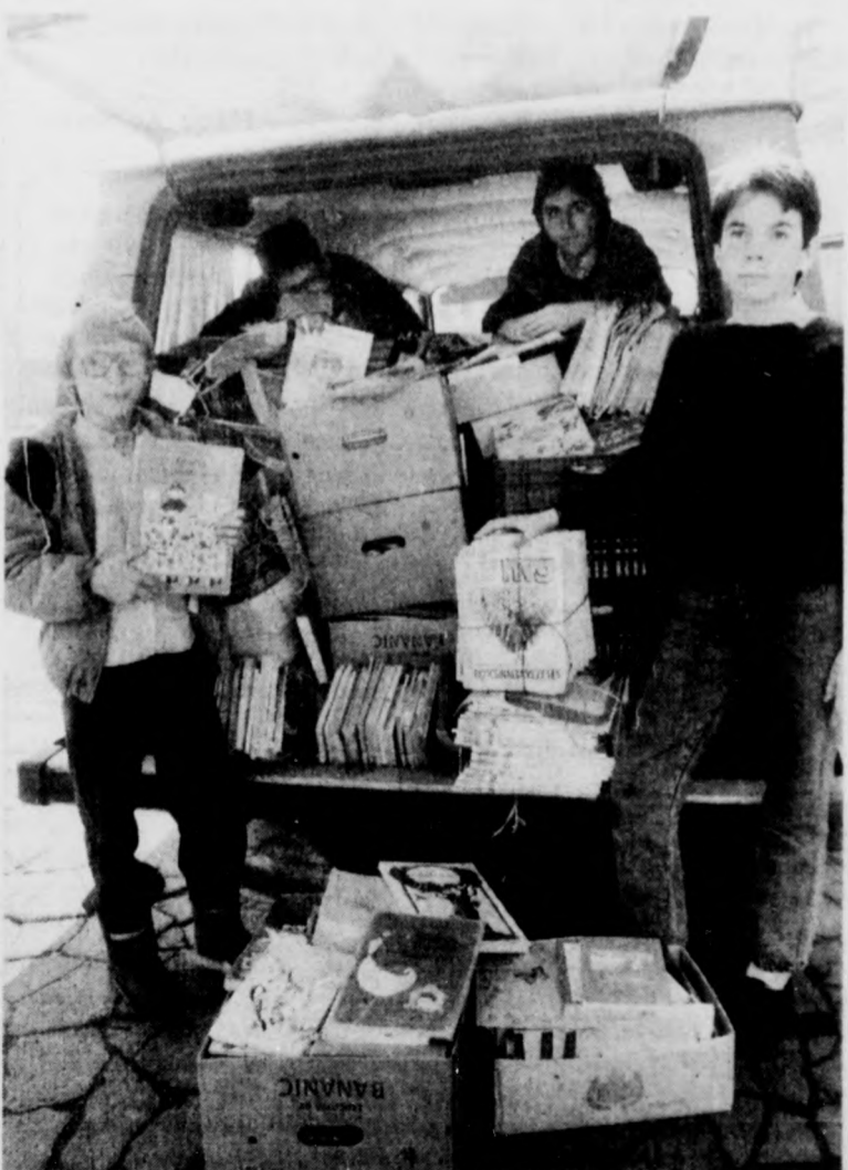
A „határlátta” könyvek újra Debrecenben szombaton délután

– Különösebben nem érdekelték őket a kiszállítást engedélyező magyar vám-papírok. Kipakoltattak velünk mindent a kocsiból, be egyenesen a mellettünk álló épületbe. Összegyűlt négy román vámos, és módszeresen, egyenként kezdték lapozgatni a könyveket. Különösen néhány Hollandiából kapott magyar nyelvű bibliamagyarázat érdekelte őket. Hosszú szemlélődés