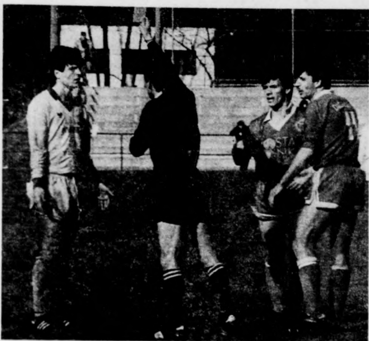
Villan a piros lap

Talán a honi futball gyengédsége, vagy a szarvasi szerencsétlen „végjáték” miatt kevés érdeklődő előtt zajlott a találkozó. Az első