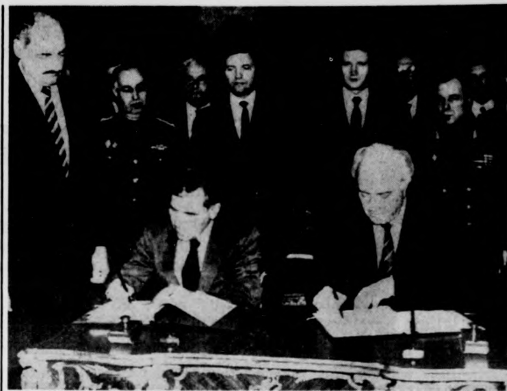
Horn Gyula és Sevardnadze aláírja a megállapodást

A Kölcsey Művelődési Központ konferenciatermében rendezett ünnepség után a résztvevők irodalmi sétát tettek Debrecenben, majd a Petőfi téren megkoszorúzták Medgyessy Ferencnek a költőről alkotott szobrát.