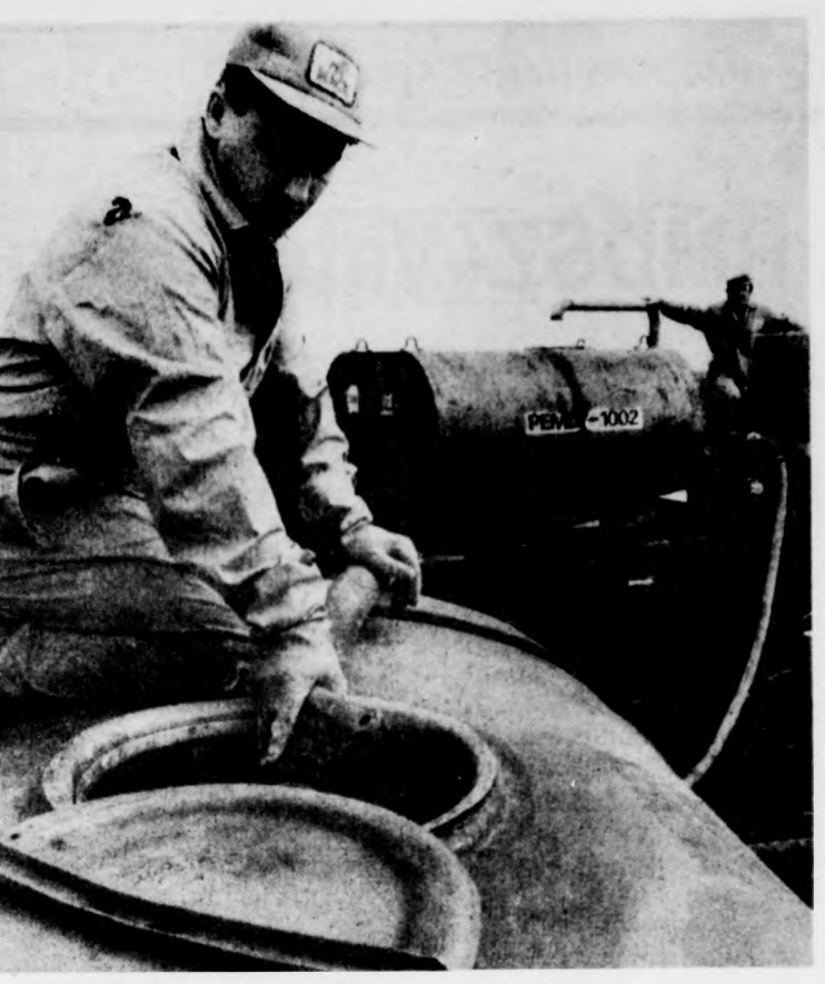
Óriás tartályban keverik a vegyszert

A tárgyalások eredményét a felek jegyzőkönyvben rögzítették, amelyet kedden írtak alá. Az iraki fél vállalta, hogy a lejárt közel 20 millió dollár értékű magyar követelést ez év májusától kezdődően év végéig kifizeti. A megbeszéléseken felmerült hosszabb távra szóló olajmegállapodás létrehozásának lehetősége. Békesi László tárgyalásait befejezve szerdán tovább utazott Kuvaitba.