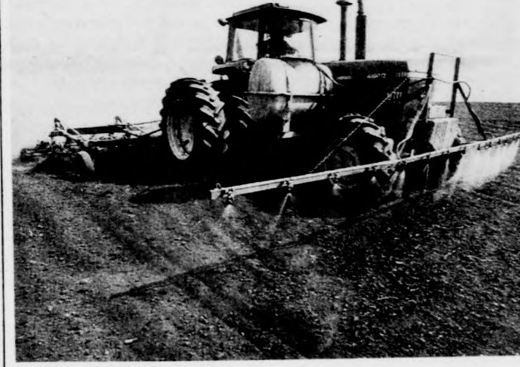
A talajfelszínre permetezett gyomirtó szert kombinátor dolgozza be a talajba

A bő két hét előny az egyéb tavaszi teendőkben is megmutatkozik. A szépen telet őszi kalászosok repülőgépes gyomirtása, a fejtárgyázás, valamint az értékesebb gyepterületek tavaszi kezelése is megtörtént.