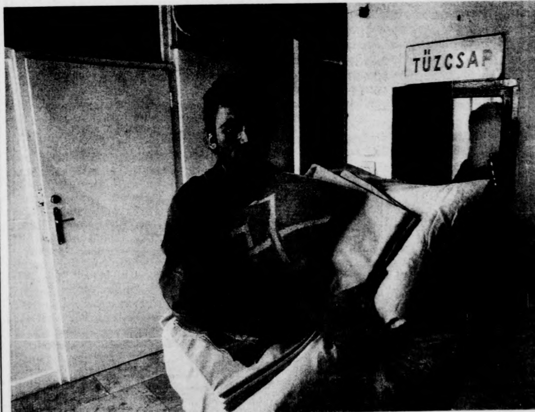
Ideje egy kicsit megpihenni