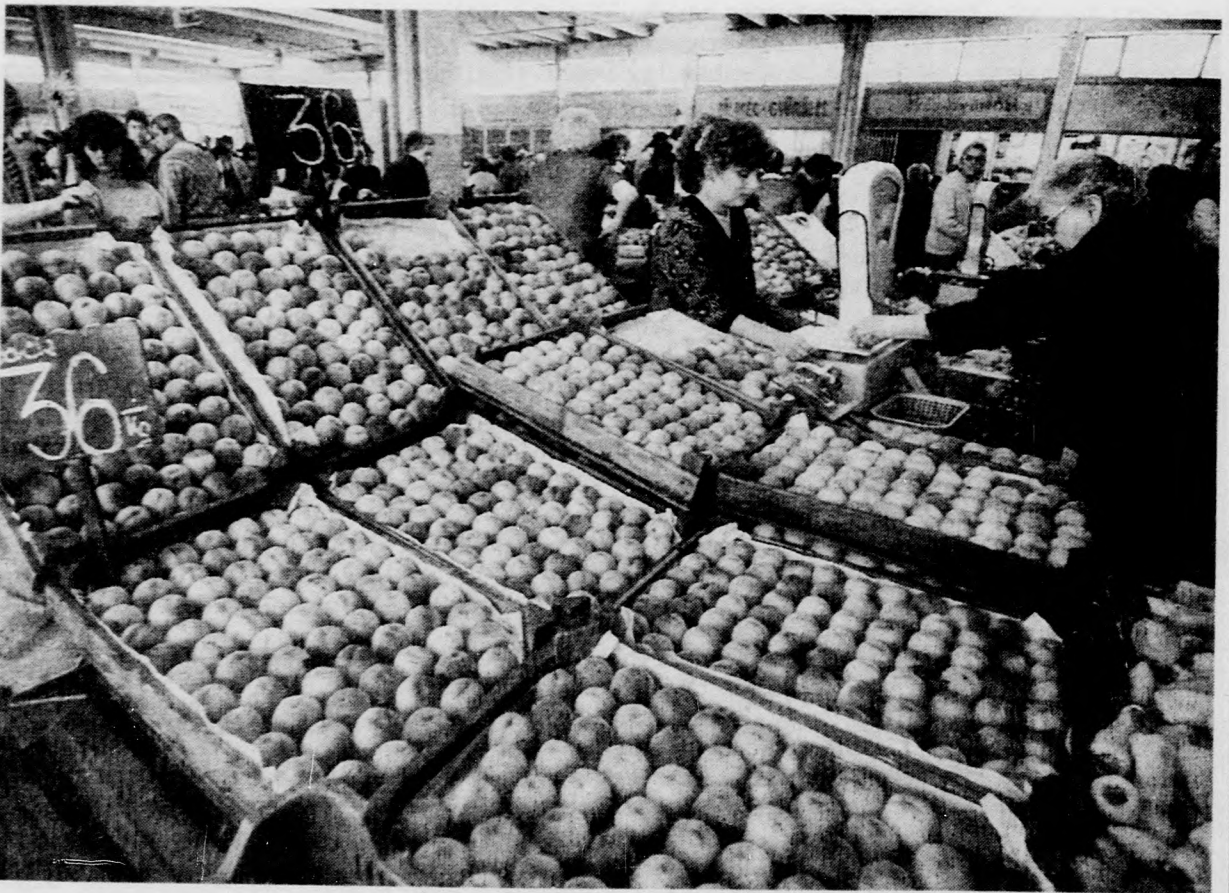
Bőséges volt a kínálat őszibarackból, és még az ára is elfogadható

Félszáz művész munkái láthatók a Fogadóban