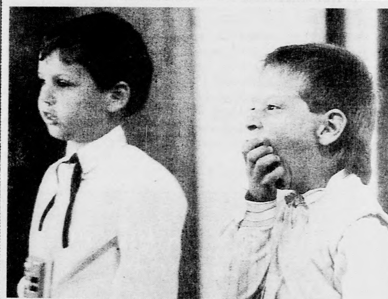
Én már unom...