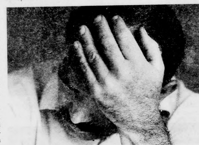
„Az elnök kijelentette; nem akar velünk dolgozni. Ezek után hogy menjek én oda aláírni a kilépési nyilatkozatot?”