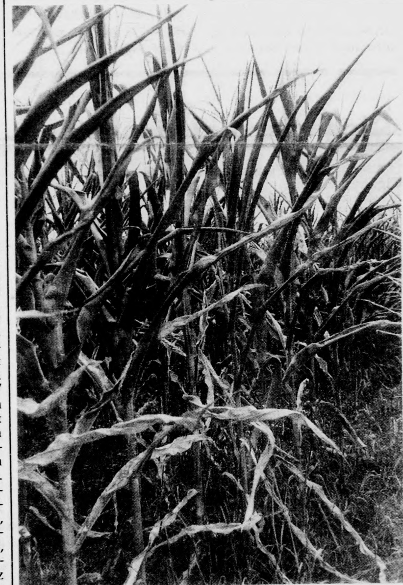
„Furulyál” a kukorica — elfújja a termést az aszály?