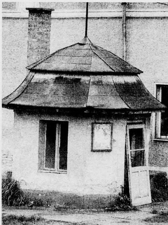
Vajon mikor sikerül gátat vetni a további romlásnak?