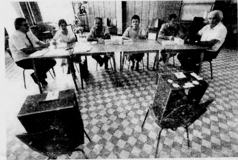
A debreceni Gulyás Pál Kollégiumban a 8-as választókerület választóinak 10 százaléka járult az urnák elé délig