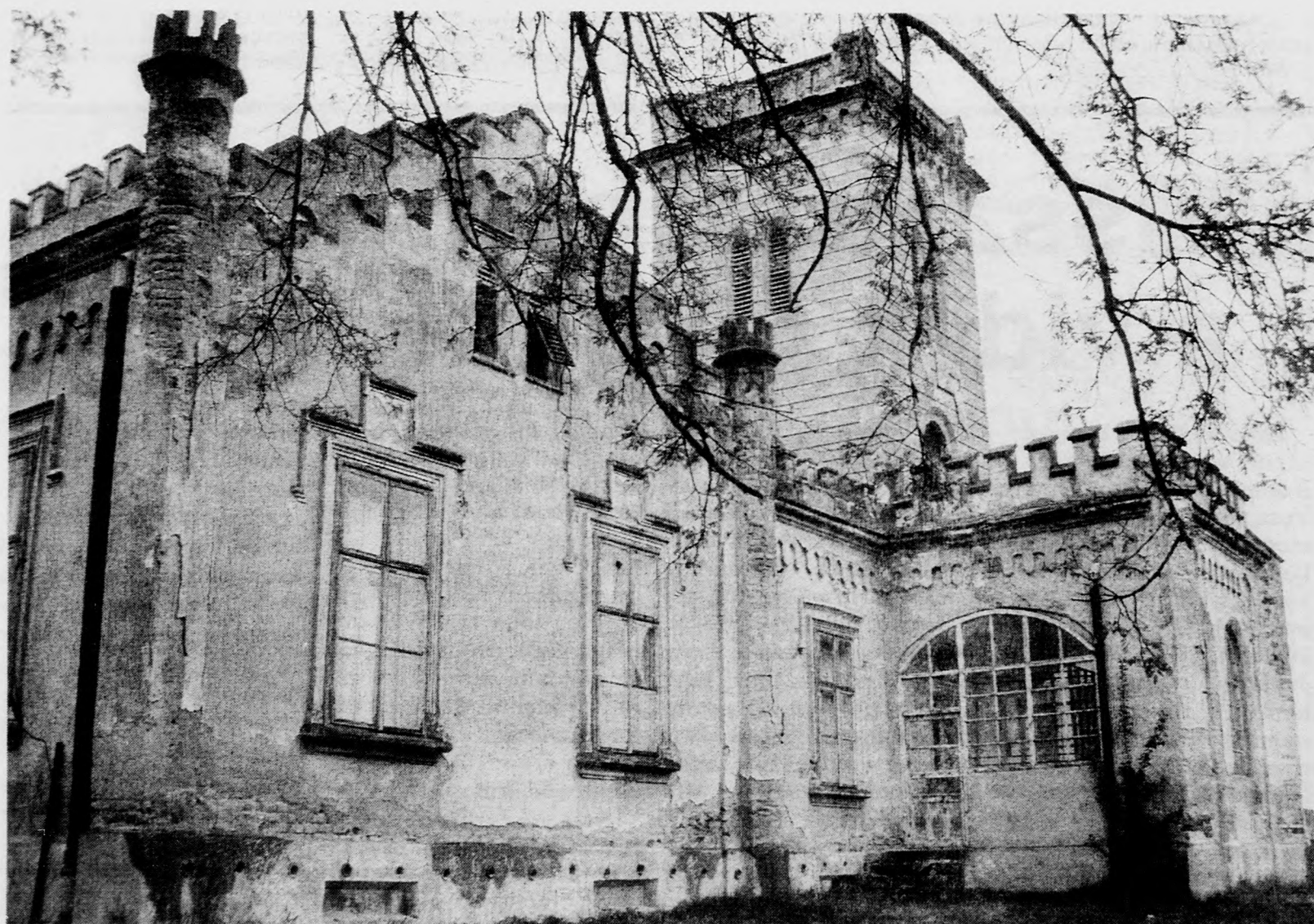
... és 1990-ben ...