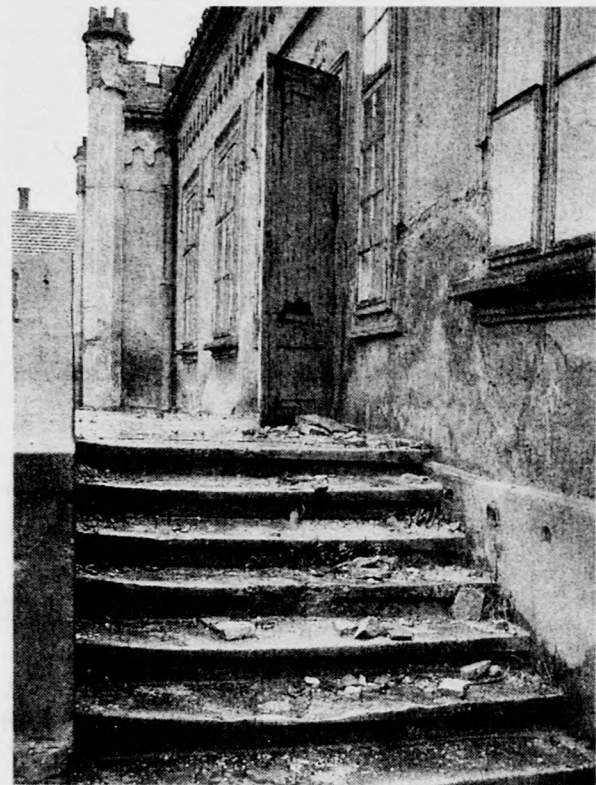
Köveit morzsolja az idő vasfoga