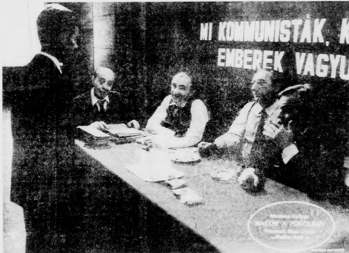
MALOM A POKOLBAN (magyar film), péntek 2. műsor 21.30

8.00 A Biblia üzenete 8.05 Kéménymesék 8.30 Torna 8.35 Ferdy 6. rész