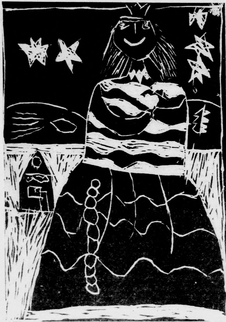
Kocsis Brigitta (6 és fél éves) rajza

Ez nem igazi égés persze. Valami egészen más. Az atommagok egyesülése közben ugyanis „elvész” valami. Minden kiló hidrogénből mintegy 7 gramm „odalesz”. Nem héliummá válik, hanem sugárzássá. Napenergiává. Enélkül mi sem jutnánk se napfényhez, se napmeleghez.