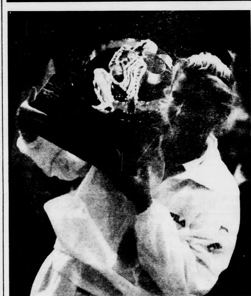
A jugoszláviai Szeles Mónika próbálja meg a magasba emelni a nehéz trófeát vasárnap este New York-ban, miután a Madison Square Garden 18 ezer nézője előtt a döntőben 6:4, 5:7, 3:6, 6:4, 6:2 arányban győzött az argentin Gabriela Sabatini ellen.

gória), 60 kg: Hugyetz Gábor (stop kategória), 74 kg: Hugyetz Lajos (nonstop kategória), 84 kg: Szűcs Zoltán (nonstop kategória); ezüstérmesek: 54 kg: Balogh Oszkár (full contact kategória), 74 kg: Hugyetz Lajos (stop kategória); bronzérmesek: Hugyetz Lajos (formagyakorlat), plusz 84 kg: Katona Barnabás (stop kategória), 84 kg: Szűcs Zoltán (stop kategória), plusz 60 kg: Szűcs Éva (stop kategória) 60 kg: Váby Gabriella (stop kategória), 60 kg: Hortobágyi János (nonstop kategória).