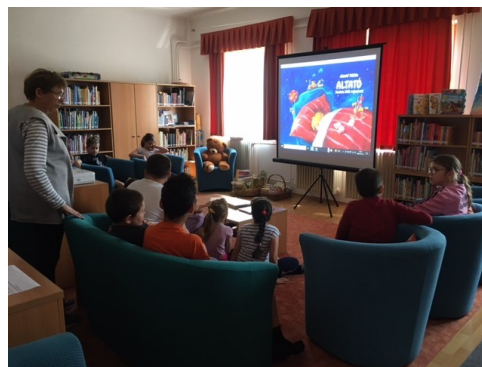
Magyar Költészet napja