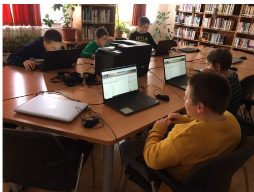
Internet Fiesta: Írjuk jól