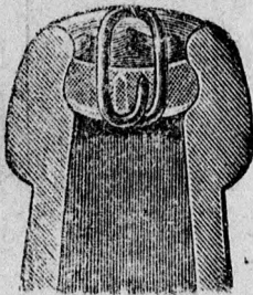
Az üveg keresztme tszete.

Van szerencsém tisztelt vevőimmel és a fogyasztó közönséggel tudatni, hogy söröspalackjaim teljesen légmentes elzárására sikerült a „The General Bottle Seal Syndicat Limited” London-i cég szabadalmát a helybeli piac részére kizárólagos használatlall megajernem.