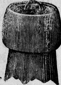
A Seal-dugóval elzárt üveg.

Midőn még a fogyasztó közönség szives figyelmét felhívom arra, hogy akár a fent említett rendszerű elzárással, akár a közönséges czégbőregetéses parafadugóval ellátott üvegekben valódi „Dreher”-féle serfőzvény csupán az itt látható védj gyes czimkével kapható.