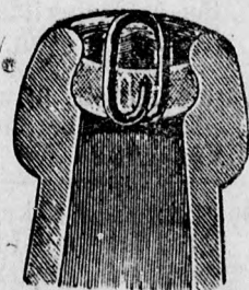
Az üveg keresztmetszete.

Midőn még a fogyasztó közönség szives figyelmét fel hívom arra, hogy akár a fentemlített rendszerű elzárás sal, akár a cégbe-égetéses parafadugóval ellátott üvegekben valódi „Dreher“-féle ser csupán az itt látható védjegyes cimkével kapható, — magamat a nagyérdemű vevőközönség szives pártfogásába ajánlva, vagyok