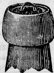
A Seal-dugóval elzárt üveg.