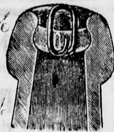
Az üveg keresztmetszete.

Midőn még a fogyasztó közönség szíves figyelmét fel hívom arra, hogy akár a fentemlített rendszerű elzárás sal, akár a cégbe-égetéses parafadugóval ellátott üvegekben valódi „Dreher“ féle ser csupán az itt látható védjegyes czimkékel kapható, — magamat a nagyérdemű vevőközönség szíves pártfogásába ajánlva, vagyok