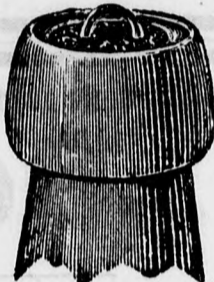
A Seal-dugóval elzárt üveg.

Van szerencsém tisztelt vevőimmel és a fogyasztó közönséggel tudatni, hogy söröspalackjaim teljesen légmentes elzárására sikerült a „The General Bottle Seal Syndicat Limited“ londoni cég szabadalmát Debreczen és vidéke részére kizárólagos használatlaltal megnyernem.