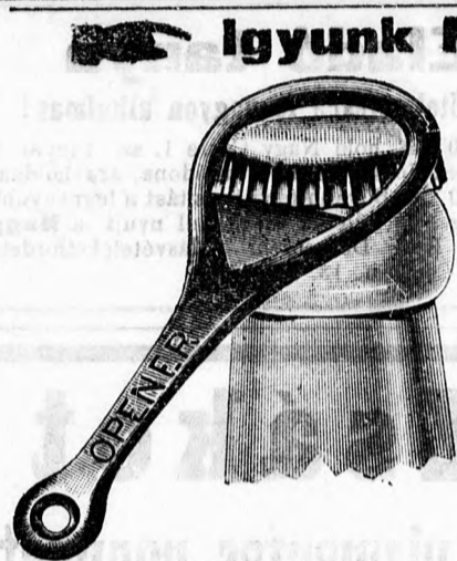
Ráteendő a nyitásnál.