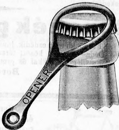
Ráteendő a nyitásnál.

A Nagymihályi sör mindennemű és fajta sörrel felveszi a versenyt, ugy ár mint minőség tekintetében