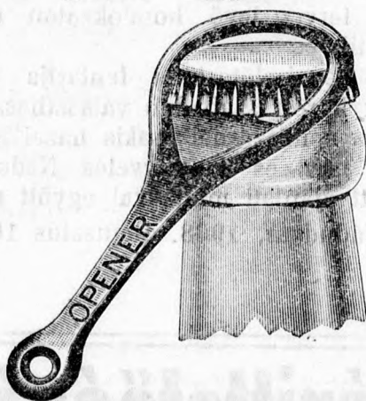
Ráteendő a nyitáshoz.