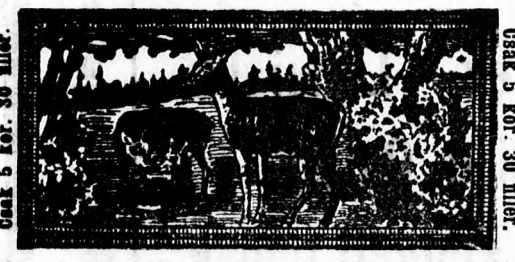
Csak 5 kor. 30 fillér.

Fali szőnyeg senilléből 5 K 30 fillér, 100 cm. széles, 200 cm. hosszú