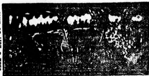
Csak 5 kor. 30 fillér.

Fali szőnyeg senilléből 5 K 30 fillér, 100 cm. széles, 200 cm. hosszú