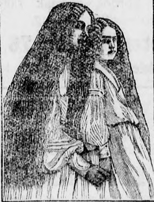
A feltaláló leányai.