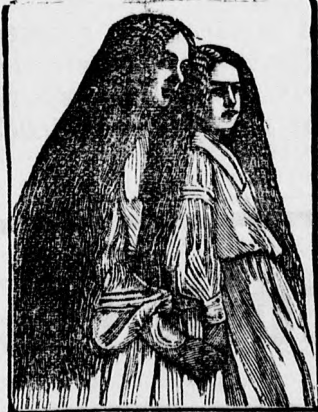
Kapható Jóna és Jóna gyógyszerkereskedésben, valamint minden gyógyszerárban és illatszerekkereskedésben.