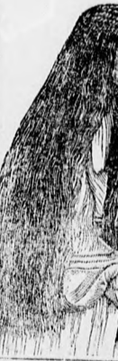
Kapható Iósa és