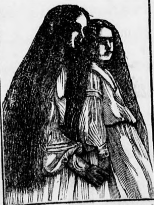
Kapható Jóna és Jóna gyógyszerkereskedésben, valamint minden gyógyszerárban és illatszerekkereskedésben