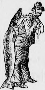
Az Emulsió vételénél a SCOTT-féle eljárás védjegyét — a halászt — kérjük figyelembe venni. Utánzatoktól óvakodjunk.

erősítő szerre van szükség. Am hatékony is legyen a szer! Például a SCOTT-féle Emulsió! Próbálja meg és jelentékenyen jobban fogja magát érezni már igen csekély adagok szedése után. Ennek oka először az, hogy azon anyagok, amelyekből a SCOTT-féle Emulsió készül, tiszták és kitűnő minőségűk. Második oka pedig a SCOTT-féle gyártási eljárás, mely párját ritkítja. A