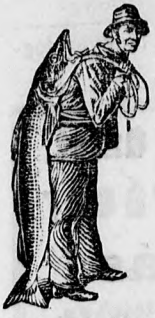
Az Emulsió vételénél a SCOTT-féle eljárást vedd figyelembe! — a halaszt — kérjük figyelembe venni. — Utánzatoktól óvakodjunk.

fájdalom nélkül nő, fogzás közben nincsenek görcsök, sem bélzavarok, ha SCOTT-féle Emulsiót használunk, nyugodtak lesznek az éjszákák, a fogak pedig erősekre és fehérekre fognak fejlődni. Harmincnégy éves hirnév áll jól a mondottak igazságáért. A szopós gyermekek kétségkívül szeretik a