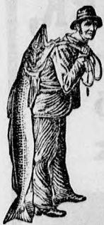
Az Emulsió vételénél a SCOTT-féle eljárás védjegyét — a halászt — kérjük figyelembe venni. Utánzatoktól óvakodjunk.