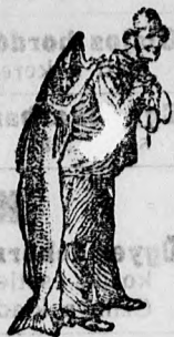
Az Emulsió vételénél a SCOTT-féle olajárak vedlygyét - a hátsó - kérjük figyelembe venni. Utanszoktatóvákokojánk.

mindig megment a SCOTT-féle Emulsió, mely a közönséges csukamájolajjal ellentétben valóságos csemege és a tejnél is könnyebben emészthető. Ezenkívül sokkal hatékonyabb, mint a közönséges csukamájolaj. Az üdvs hatás az első egynehány adag után mutatkozik, oly nagy az alkatrészek tisztasága és hatása. A