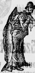
As Emulsió vétele... A SCOTT-féle eljárás védjegyét — a halaszt — körük figyelembe venni. — Utána köztől óvakodjunk.

által okozott kinokat jelentékenyen csökkenti a SCOTT-féle Emulsió már az első egy-néhány adag után. A számarköhöjés enyhítésére a SCOTT-féle Emulsió kitűnő alkalmazhatóságát a legtisztább és legkiválóbb alkatrészek, valamint a maga nemében páratlan SCOTT féle eljárás biztosítja. A