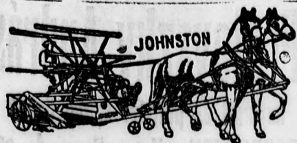
A világhírű eredeti amerikai Johnstons kévekötő aratógép.

— Imádom s ő is nagyon szeret — elvállik az uratól s a feleségem lesz. És az én életemnek egy célja lesz: boldoggá tenni.