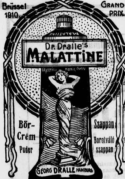
Tube 70 fill. és 1 K 20 fill.

Szabó Lajos Fiai üzégnél, DEBRECZEN, Rózsator.