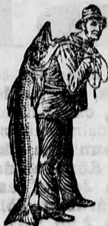
Am Emulsió vételénél a SCOTT-féle eljárás védjegyét — a halászt — kérjük figyelembe venni. Üzenetektől óvakodjunk.

által okozott kinokat jelentékenyen csökkenti a SCOTT-féle Emulsió már az első néhány adag után. A számarköhögés enyhítésére a SCOTT-féle Emulsió kitűnő alkalmazhatóságát a legtisztább és legkiválóbb alkatrészek, valamint a maga nemében páratlan SCOTT-féle eljárás biztosítja. A