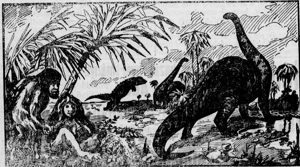
Rendes Uránia helyárakkal.

„A szerző személyes vendégszereplésével.”