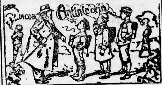
Vigyázzon! Csakis a „JACOBI” jellel valódi

"H-i-i-i?" Papa megengedte! Hisz' valódi JACOBI-téle Aninacotin-cigarettahüvelyek fadobozbaul!