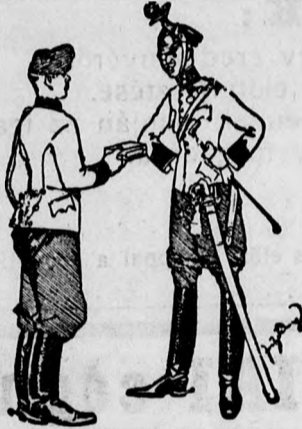
Ficku! Még most sem jegyezted meg magadnak, hogy csak Jacobi antinicotin szívarka-hüvelyt szíved!

Panhans szálloda a hozzátartozó János főherceg nagyszállodával, 400 szoba. Legnagyobb kényelem. Az Osztrák Téli sportkör székhelye. December közepétől március végéig naponként két hangverseny, sporttársasjátékok, művészi akadémiák, humorisztikus esték, jelmez- és jégünnepegy, 1 mester-ski-ugrómérkőzés (Európában a legszebb), 4 gyakorló-ugrómérkőzés, 1 mű-bob futópálya, 4 ródli-pálya. Villamos felvonó, mely a kiindulási ponthoz való visszajutást a sportszerszámokon (bobs leigh és ródli) lehetővé teszi; nagy skiterületek. Korcsolyázótér. Minden vasárnap téli sportünnepegyek, naponként ródli futás, skiugrás. Téli sport-tanítók. Skikjöring-utazások, gyinkhanajátékok. Farsangi ünnepegyek.