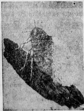
Vértetű szárnyatlan alakja sokszorosan nagyitva.

A réz és kén tökéletes vegyi egyesülése által, minden állati és növényi élősdit gyökeresen elpusztít. Sikeresen alkalmazható az összes rovar ellenségek, mint: vértetű, almamoly, szőlőmoly, paizstetvek, stb. stb. Továbbá az összes gombabetegségek ellen, mint peronospora, oidium monilla, fusioladium, a pöszmété lisztharmata, őzsi barack fodrosodása, stb. ellen.