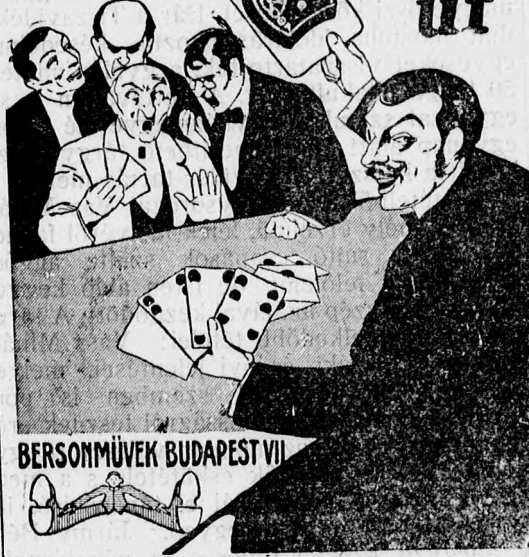
BERSONMŰVEK BUDAPEST VII