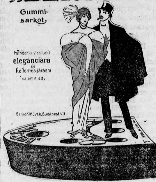
Bersonművek, Budapest VII

mindenki viseli, akit eleganciára és kellemes járásra valamit ad,