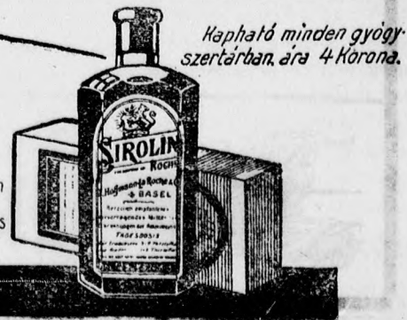
Kapható minden gyógyszerertárban, ára 4 Korona.