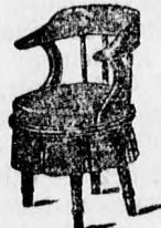
Barna vagy fekete bőrpesztűvel, párnázva, porcellán vagy email védéssel. Ára csomagolva és bérmentve 70 kor. Párnázatlan és fodor nélküli csak 66 k.

hygen. légmentesen elzárható szobaklozzettek, száraz klozzettek, Bidet és betegasztalok különlegességi gyára