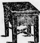
Puha fából, barnára fényezve email védéssel. Ára csomagolva és bérmentve 35 kor. Keményfából 40 kor.