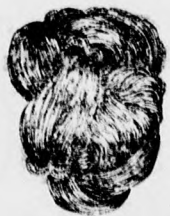
Fonott konty hosszú hajból