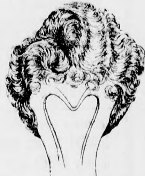
Bandeau ferde sopffal