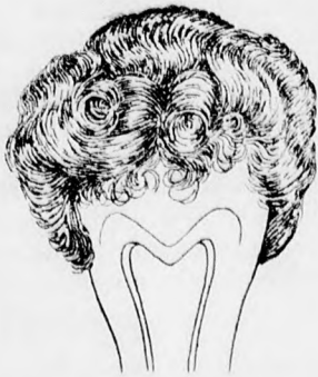
Bandeau rövid hajjal