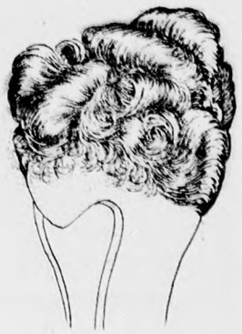
Előfrizura chignonnal összekötve