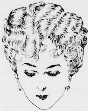
Használatban fel nem ismerhető