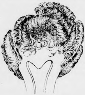
Schopf-frizura rövid hajjal