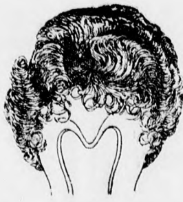
Bandeau rövid hajjal