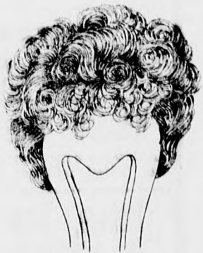
Bandeau rövid hajból

hajmunka megtartja állandóságát, miután a legfinomabb természetes hajból készül.