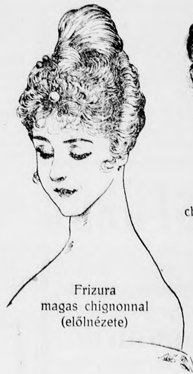
Frizura magas chignonnal (előnézete)