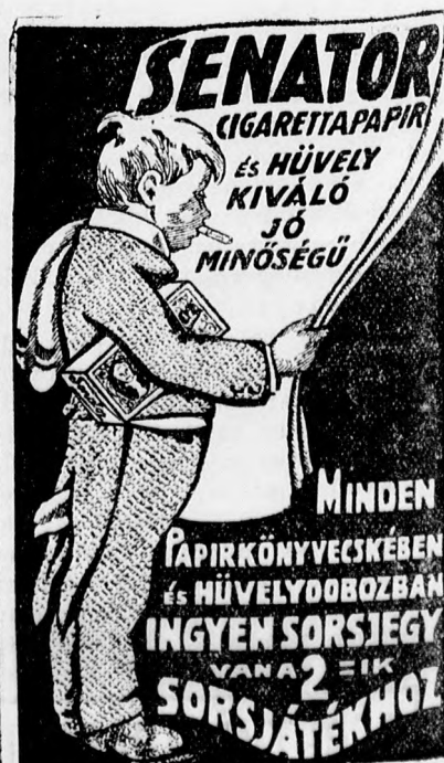
Az I. sorsjáték sorsjegyei még március 1-ig érvényesek.