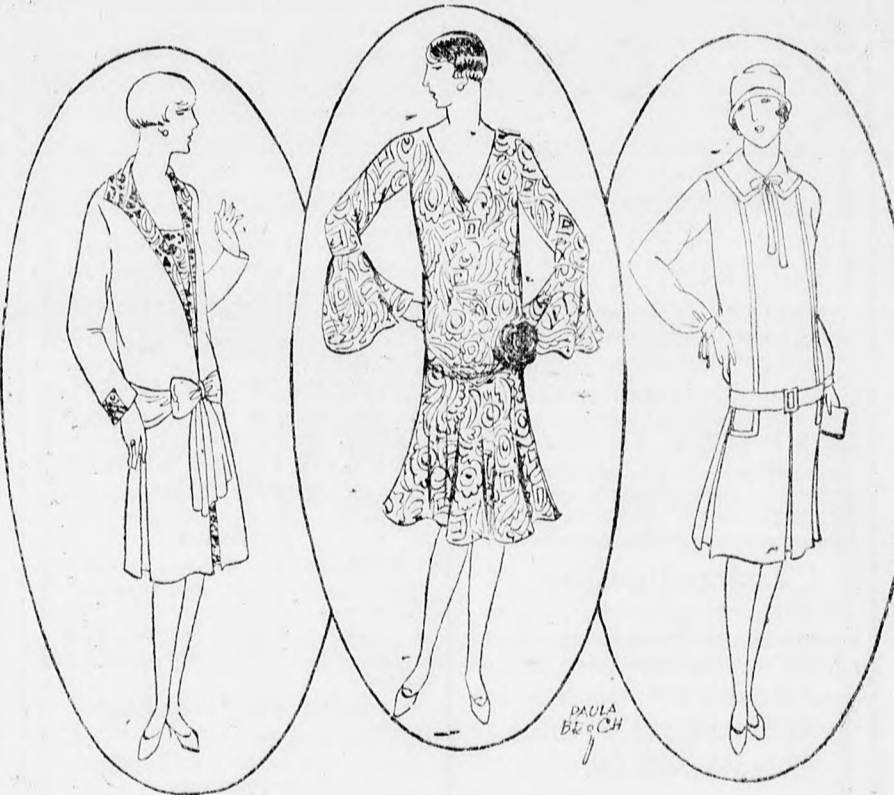
Három új modell

Úgyes megoldás még a tarkamintás selyemruha. A virágos pongis, foulard, kinaselyem, marokko-krepp, a nyomtatott georgette