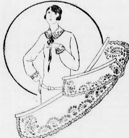
Madeira-gallér és kézelő

és a habos gazéből készült lenge délutáni, illetve estélyi ruha nyáron is jó szolgálatot tesz. A könnyű selyemruhának több célra való felhasználása azért lehetséges, mert a divatos estélyi ruha különlegessége a hosszu uj. Ezt valószínűen sokan üdvözlök nagy örömmel.