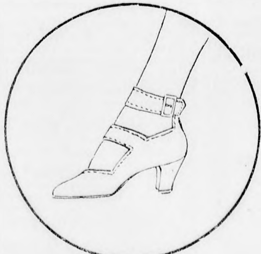
Divatcipő bo kaszijjal

Nagyon divatos a hehuzott, vagy plissirozott valenciennes-csipkével határolt madeire-himzéses gallér és kézelő. A madairahimzés különben nagy szerepet fog játszani a nyári ruhánál is, nemcsak mint gallér és kézelő, hanem a lyukacsos, finom himzés elborítja majd az egész ruhát.