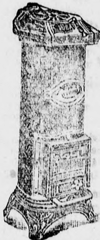
árak a legjutányosabban szerezhetők be!