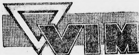
a LUX gyárak készítménye

Szörjön Vim-et nedves ruhára, vagy nedves kefére. Vim-et sohase használjon szárazon. A tisztítandó tárgyat egész könnyedén kell súrolni, az egy pillanat alatt ragyogóan tiszta és szinte új lesz. Tekintettel kiadtságára, a Vim csodálatosan olcsó. Vim mindenütt kapható.