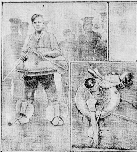
Nem lehet többé vízbefulladni!