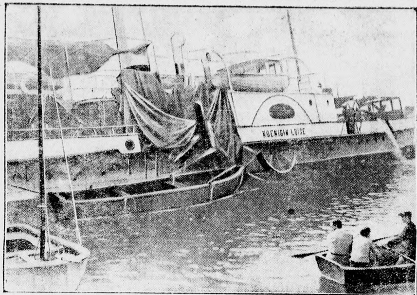
Sikerült megmenteni egy súlyedő német személyszállító hajót. A „Königin Louise” kedden összeütközött nyílt tengeren egy angol személyszállító hajóval. A német gőzös súlyosan megsérült és utasai egymásután vetették magukat a tengerbe. A sérült hajót nehezen partravontatták. — A „Königin Louise”-nek mintegy 40 utasa eltűnt, vagy súlyosan megsebesült.