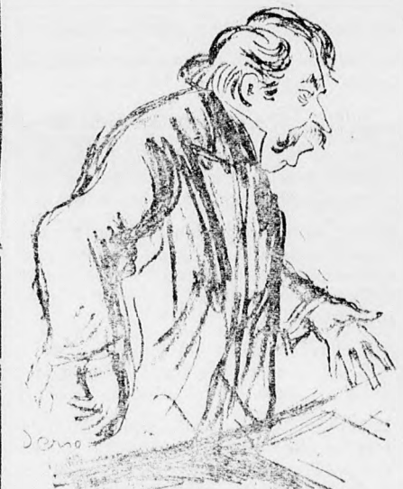
Briand francia külügyminiszter tegnap igyekezett kimagyarázni legutóbbi németellenes beszédét.

Vasárnap délelőttre tüzték ki a konferencia folytatását, amikor már ismét Genfben lesz Briand, ez pedig annyit jelent, hogy megtalálták a kedvező alapot, amely megegyezéssel bízta.