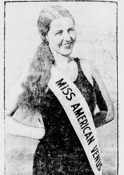
Miss Violet Allin, az amerikai szépségverseny ezidei győztese, Európába jön, hogy „Miss American Venus” büszke címével induljon a Párisban rendezendő világszépségversenyre.

tes afelől érdeklődik, hogy nem lehetne-e a járványkórházi kezelést a tiszti orvosi karral megoldani. Szükség van-e külön orvos beállítására? A klinikán legalább annyi beteget el kell helyezni az idén is, mint tavaly.