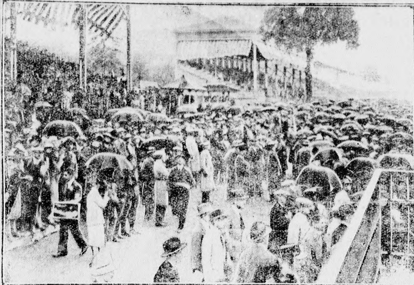
A monzai tömegkatasztrófa színhelye.

5 pengőt megtakarít autótaxi költséget, mert gyalog átjöhét egy perc alatt a pályaudvarról. Nálunk otthon érzi magát! Elsőrendű kiszolgálás szigorúan családi jelleg. Saját érdeke ezen előnyök folytán, hogy okvetlenül nálunk szálljon meg. Előzetes szobabemutató, rendezés ajánlatos. Új telefonos szobák.